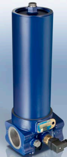
Contenitore Filtro serie UR310